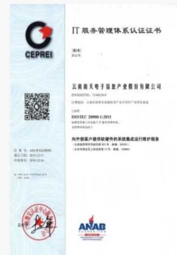
ISO20000-1:2011 IT服务管理体系认证