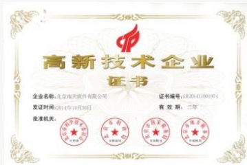
重点高新技术企业