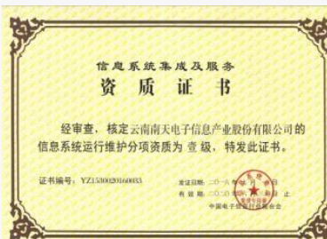
信息系统运维一级资质