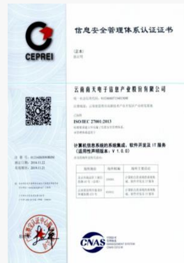
ISO27001:2013 信息安全管理体系认证