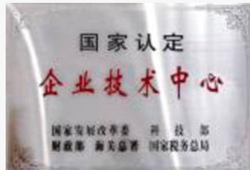
国家认定企业技术中心