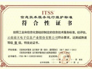
ITSS信息技术服务运维标准一级资质