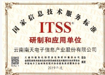
ITSS国家标准研制和应用单位