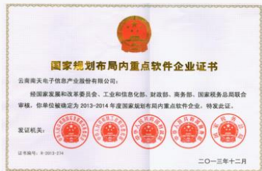
国家布局内重点软件企业