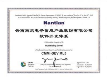
SEI CMMI5级认证 (软件成熟度)