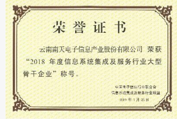
信息系统集成及服务“大型骨干企业”