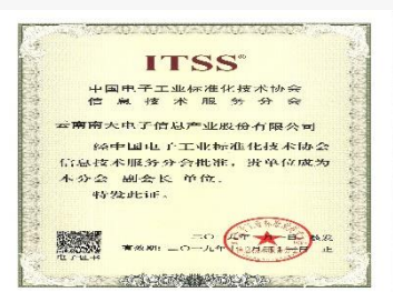
ITSS中国电子标准技术协会副会长单位