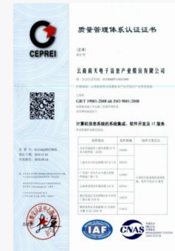
ISO9001:2008 质量管理体系认证