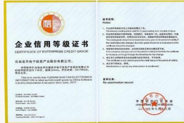
信用评价AAA级信用企业证书