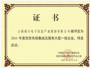
系统集成大型一级资质